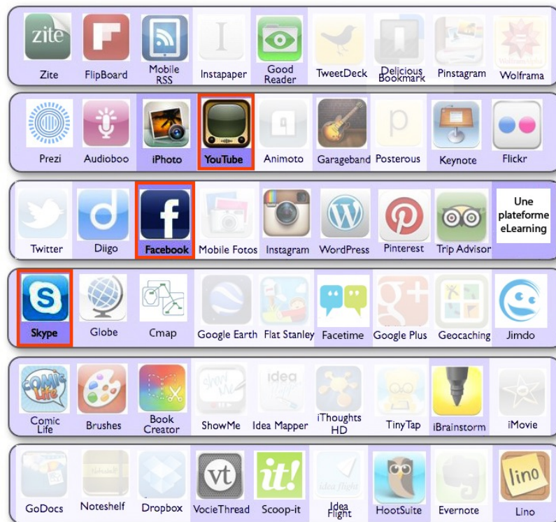
Figure 2. Trois outils obtiennent plus de 20 déclarations d'usage (cadre rouge), deux 10 déclarations (violet accentué), vingt-six entre 1 et 5 mentions (violet pâle) et vingt-deux aucune mention (voilés) ( n = 32 )

Des éléments issus des tâches à réaliser pour le cours renforcent la perspective d'une familiarité modérée des enseignants-participants avec les technologies pour l'éducation. Ainsi, 16 participants ont choisi de réaliser une des activités en relation directe avec une problématique techno-pédagogique. Les usages dont ils rendent compte à cette occasion sont modestes et peu nuancés. Six participants déclarent (pouvoir) utiliser l'« école virtuelle » de leur établissement pour déposer des contenus de cours, des exercices supplémentaires et gérer la remise de travaux. Les usages mentionnés sont en outre tempérés, dans le chef de certains participants, par des considérations telles que le caractère chronophage de la mise en ligne de supports d'apprentissage, la concurrence potentielle de l'eLearning par rapport aux formes d'enseignement traditionnelles, le manque d'assiduité des étudiants confrontés à un environnement virtuel et, chez les participants qui avouent manquer d'expérience dans le domaine de l'eLearning, par des questionnements relatifs à son utilité et à sa pertinence dans leurs pratiques d'enseignement quotidiennes.