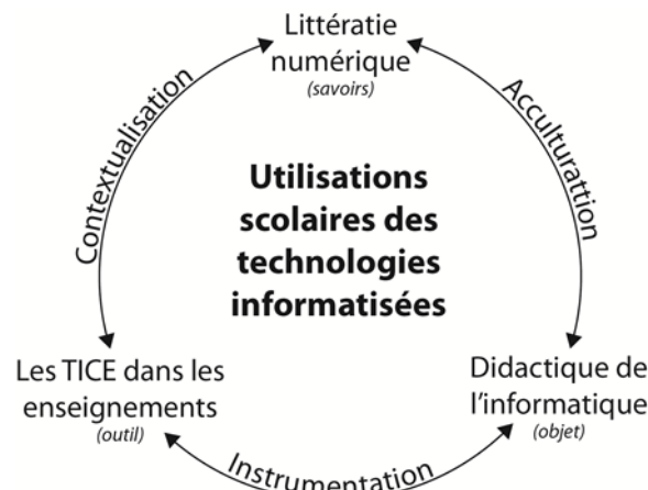
Figure 1 : Attracteurs scolaires des TI et processus ICA (instrumentation, contextualisation, acculturation)

Le modèle AFRI est une entrée systémique dans nos travaux (ce qui fait système pour l'adoption ou le rejet des technologies informatisées). Pour nos besoins d'analyses des conceptions enseignantes et de leurs trajectoires d'appropriation, nous développons un autre modèle, centré sur la place occupée par ces technologies dans les pratiques de classe, le modèle ICA (processus Instrumentation – Contextualisation – Acculturation). Nous en discutons dans ce texte. Ce deuxième modèle fonctionne comme un analyseur des pratiques. Il articule les trois niveaux d'intervention dans lesquels les technologies informatisées peuvent être mobilisées : Les TICE dans les enseignements (un outil pour les apprentissages), Littératie numérique (un ensemble de savoirs à appréhender, volet épistémiques de l'informatique et de ses technologies), Didactique de l'informatique (l'informatique objet, à apprendre pour ce qu'elle est). Nous présentons le modèle ICA dans la figure 1.